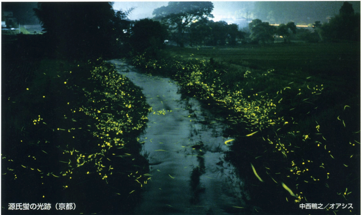
源氏螢の光跡 (京都)